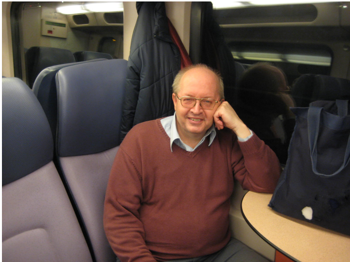
In de trein, op weg naar huis, na het frontiersymposion in A'dam, 7/11/2009