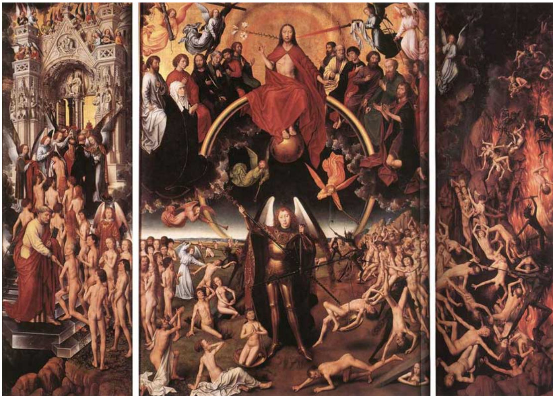
Hans Memling: Het laatste oordeel met Michael als zieweweger

Michael als zieweweger na de dood en het laatste oordeel staat voor de toekomst , als Hij oordeelt over de Geest, het IK van de mens.