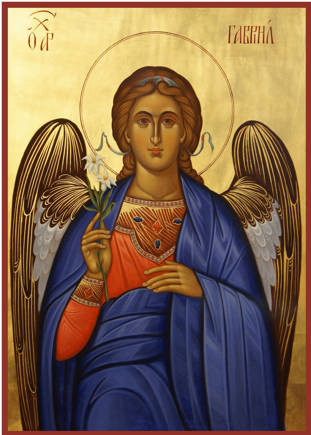
De Maan-aartsengel Gabriel met de witte lelie: