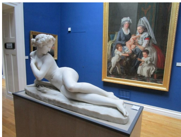
oa. James Pradier-1853 - een nymf (sculptuur);

Aan deze schone jonkvrouwen is dat wel duidelijk te ervaren: