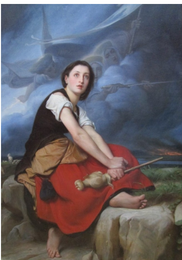
1859 - L.F.Nenuville - Jeanne d'Arc hoort stemmen