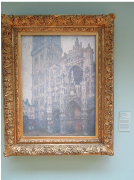
Monet: De kathedraal van Rouen !