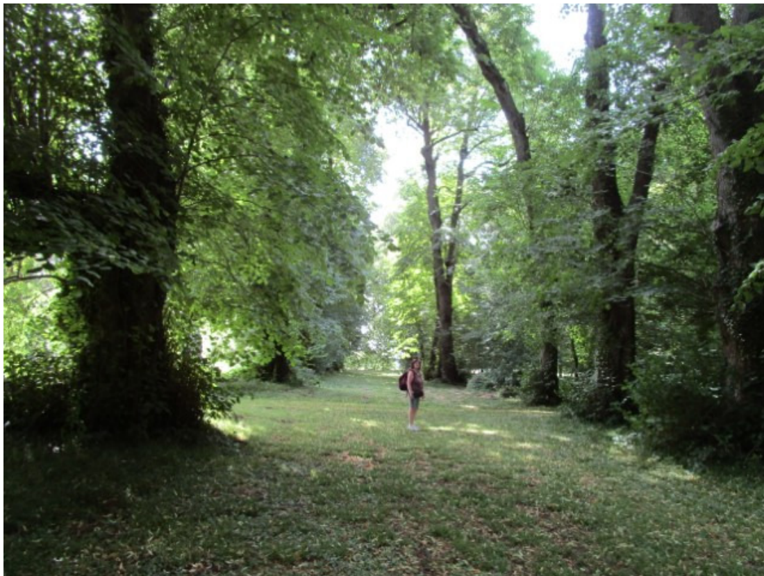
De oude lindelane !

Daarna gingen we wandelen door het kasteelpark, en dat was echt geweldig vanwege de enorm oude beuken- en lindelane !!