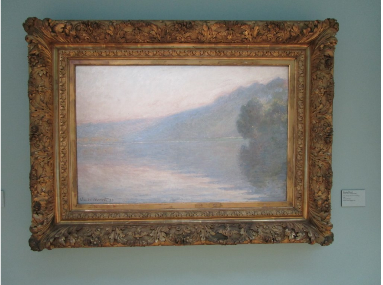
Monet: De Seine bij Port-Villez