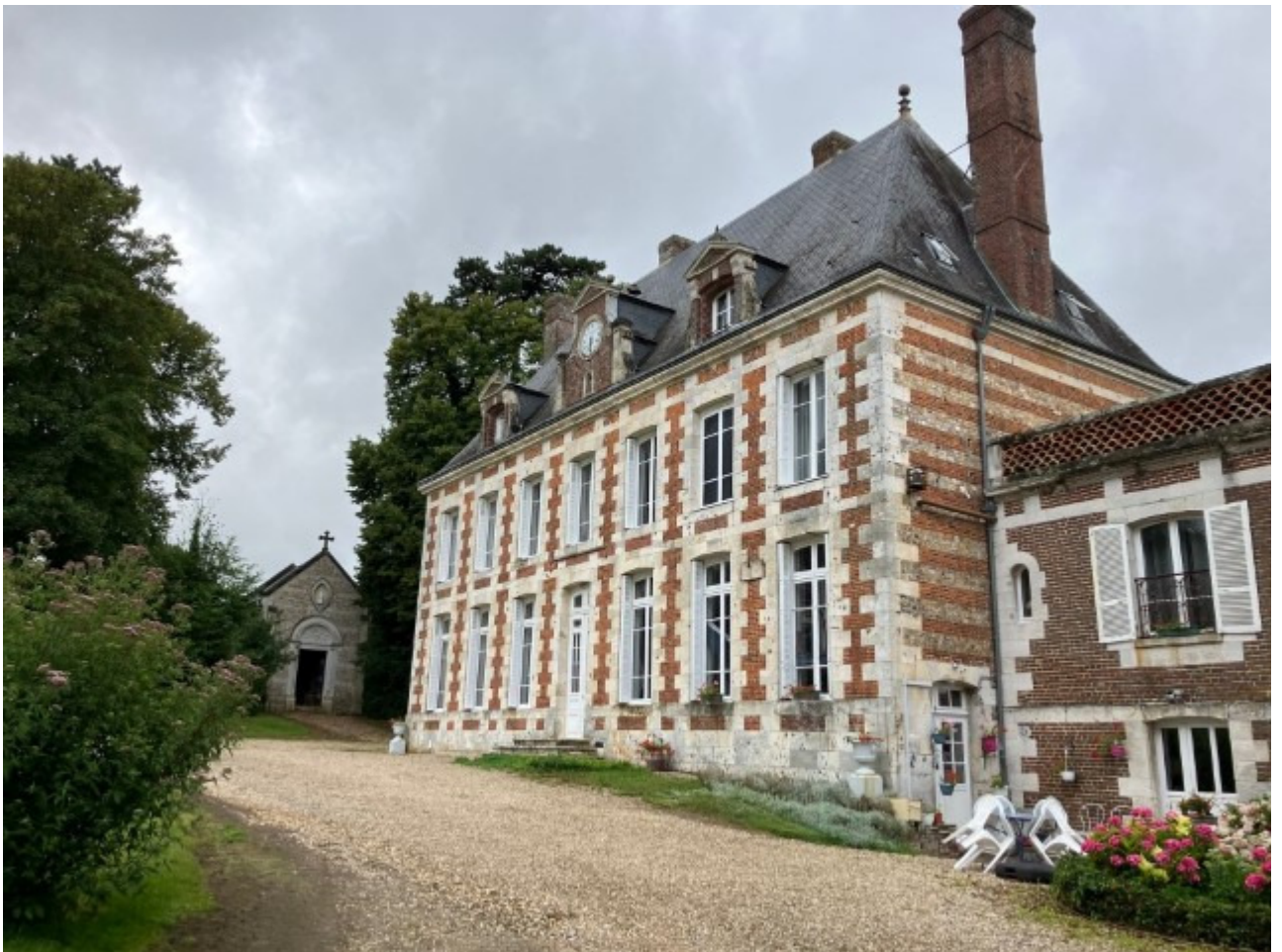
Naast het kasteel ligt een kapel.

Nu gaan we voor het eerst sinds jaren weer een week bij hem logeren (niet in het kasteel zelf maar in een huisje ernaast).