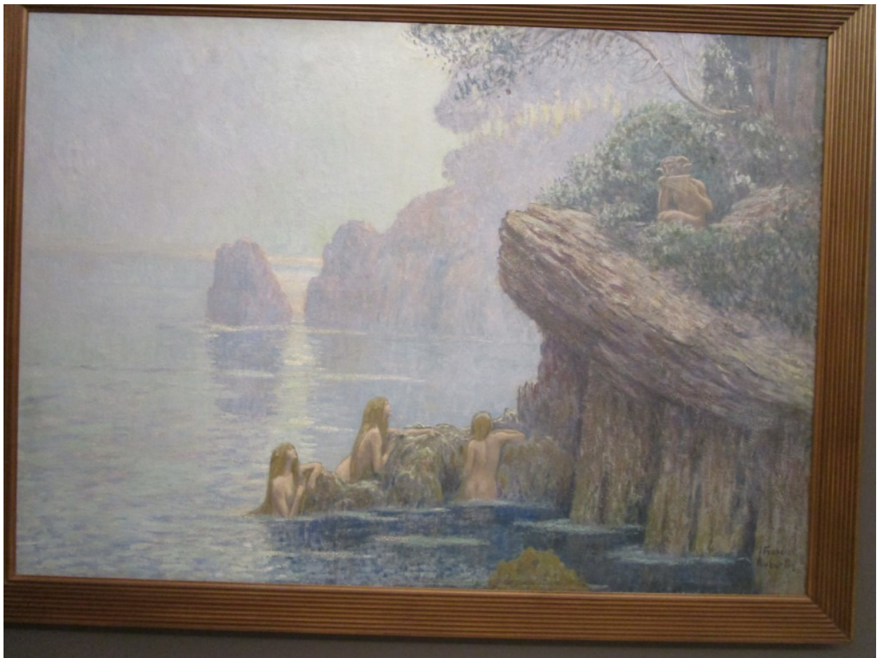
Auburtin-1907: het bos en de zee